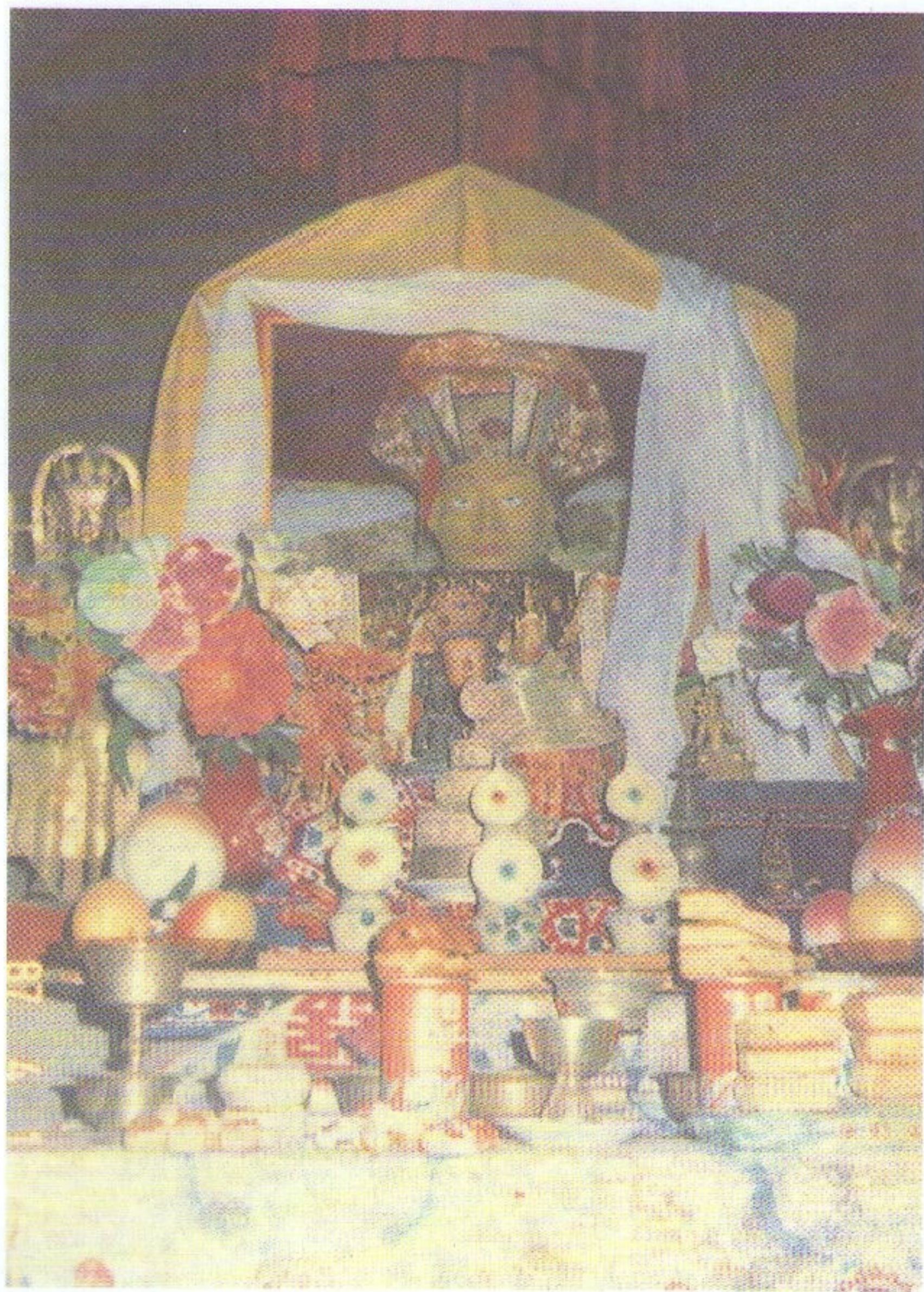
貢嘎仁波且肉身舍利相 圓寂後突然收縮到1尺5寸3分高